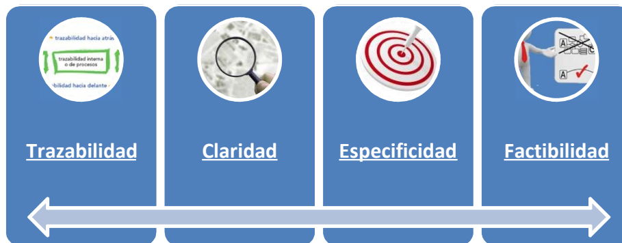
Figura 1.- Subcriterios para la calidad de la evaluación

La calidad en las recomendaciones se torna fundamental cuando hablamos del proceso de mejora continua. Recomendaciones “malas” o difíciles de entender y/o llevar a cabo en la práctica hacen que la evaluación se vuelva poco útil. Se presenta a continuación una serie de subcriterios que orientan la calidad y contundencia de las recomendaciones.